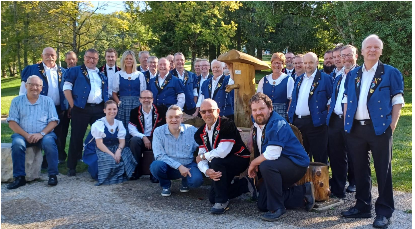
Die «Heimelig-Jodler» mit seinen Ehrenmitgliedern beim Brunnen in Maierhöfen (D)